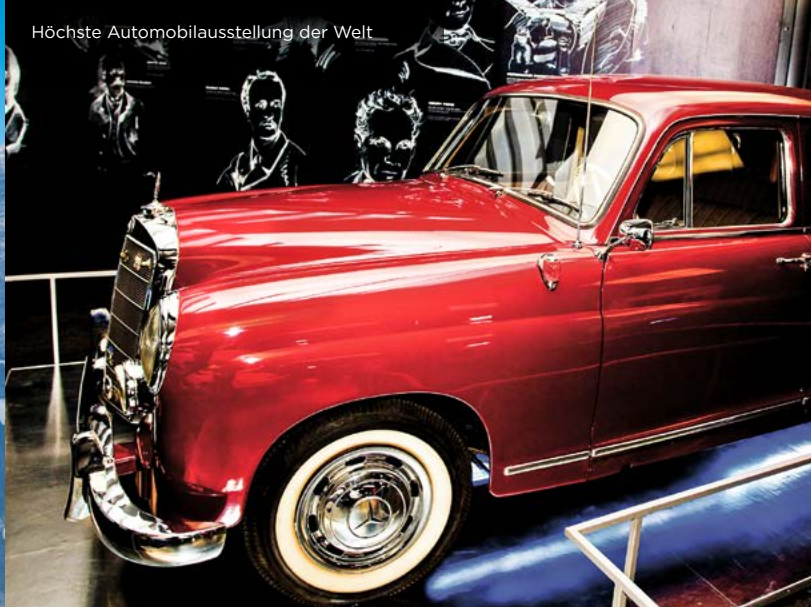
Höchste Automobilausstellung der Welt