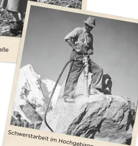
Schwerstarbeit im Hochgebirge

Die Straße zählt zu den wichtigsten Repräsentationsbauten der Ersten Republik und war Symbol für den wirtschaftlichen Überlebenswillen im Land. Am 3. August 1935 feierte man die Eröffnung der damals modernsten Hochalpenstraße. Noch heute sind die historischen Steinmauern und Straßenbegrenzungen größtenteils erhalten. Mit der Gründung des Nationalparks Hohe Tauern im Jahr 1981 wurde der Großglockner Hochalpenstraße eine weitere wichtige Funktion zuteil: Sie ermöglicht den Zugang in das Kernstück des Naturschutzgebietes.