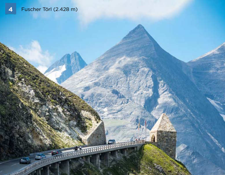
4 Fuschertörl (2.428 m)