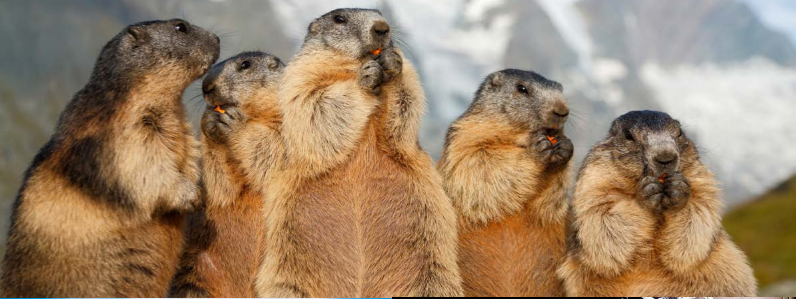
Murmeltiere – die niedlichen Pelztierchen der Alpen

TICKETS AUCH ONLINE ERHÄLTlich 48 km Panoramastraße 15 Ausstellungen 7 Themenwanderwege 30 Dreitausender kostenlose Führungen 14 Gasthöfe & Almen Spielplätze